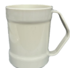
プラスチック コップ