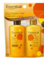
シャンプー コンディショナー